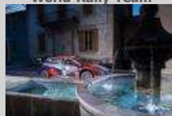
Dani Sordo Hyundai i20 Rally1 Hyundai Shell Mobis World Rally Team