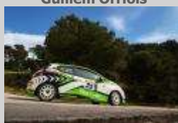
Volant RACC 2021 Guillem Orriols