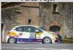
Volant RACC 2022 Pérez-Pujol