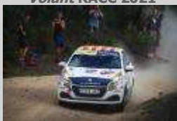
Roger Bergedà Volant RACC 2021