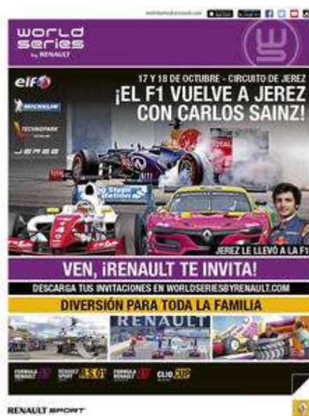
Cartel World Series by Renault

Por otro lado y como aperitivo de lo que el público podrá disfrutar el fin de semana del 16 al 18 de octubre con las World Series by Renault, los días 10 y 11 el trazado jerezano albergará el denominado "Festival de Automovilismo" que contará con varias categorías en su programa de pruebas, entre ellas, la Fórmula Renault 2.0 italiana ALPS, que compartirá cartel con las categorías portuguesas: Single Seater Series, Super 7 by Kia y la categoría de turismos clásicos denominada Classic Super Stock. La entrada al evento será gratuita, incluido el paddock. Los horarios contemplan entrenamientos contra el crono durante la jornada del sábado en el que también se desarrollarán las primeras mangas de carreras. El Domingo, el programa horario incluirá entrenamientos oficiales y las restantes mangas de carreras.